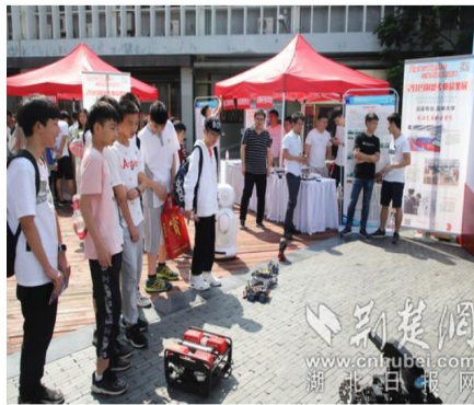
武汉交通职业学院应用电子技术专业