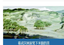
看武汉画家笔下米脂的美