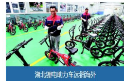
湖北锂电助力车远销海外